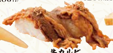
牛カルビ 210円(税込231円)