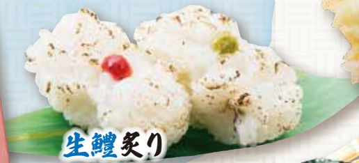
生鰻炙り 390円(税込429円)