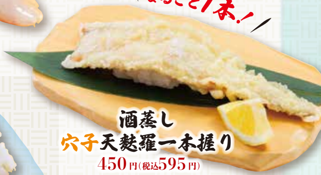
酒蒸し 穴子天麩羅一本握り 450円(税込595円)