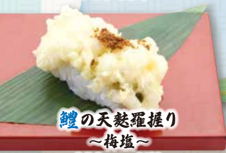
鰻の天麩羅握り ~梅塩~ 230円(税込253円)