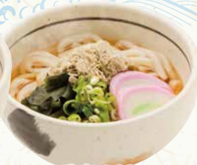
昆布うどん 360円(税込396円)