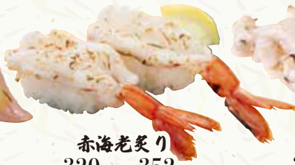
赤海老炙り 320円(税込352円)