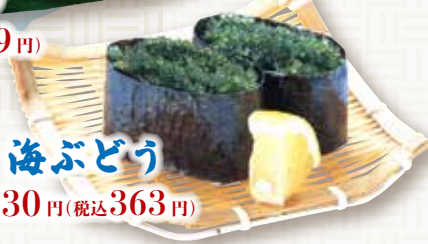
海ぶどう 330円(税込363円)