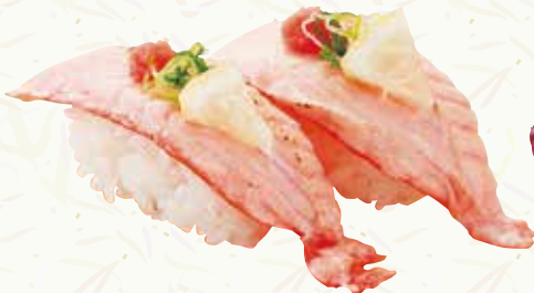
サーモン炙り 270円(税込297円)