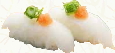
カレイのエンガワ 260円(税込286円)