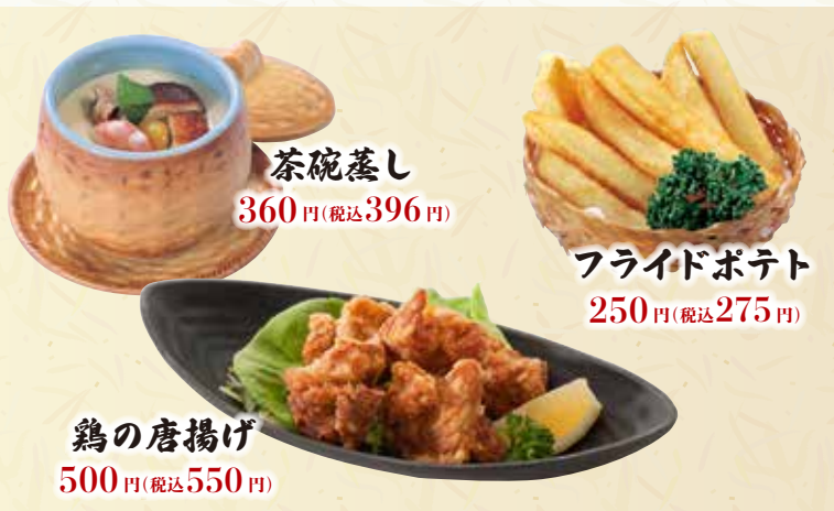
茶碗蒸し 360円(税込396円)