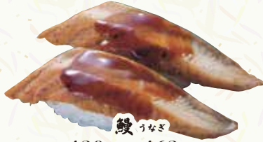
鯉 うなぎ 420円(税込462円)