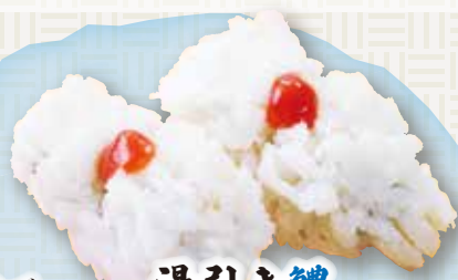
湯引き鰻 370円(税込407円)