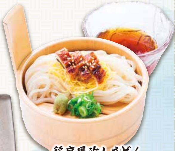
稲庭風冷しうどん