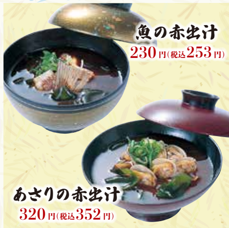
魚の赤出汁 230円(税込253円)