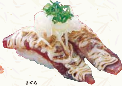
まぐろ 鮭けんちゃん焼 270円(税込297円)