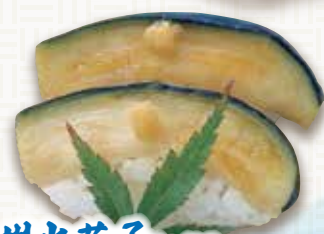
泉州水茄子にぎり 230円(税込253円)