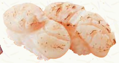
ホタテ炙り 320円(税込352円)