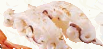
生ダコ炙り 320円(税込352円)