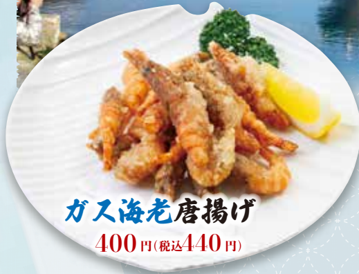
ガス海老唐揚げ 400円(税込440円)