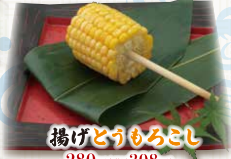
揚げとうもろこし