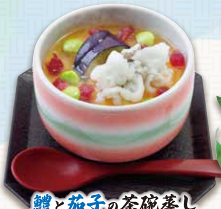
鯉と茄子の茶碗蒸し