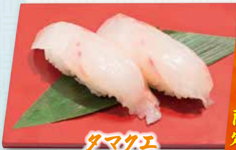
タマゴエ 540円(税込594円)