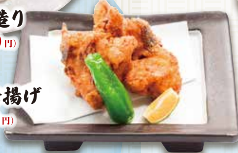
タマクエの唐揚げ