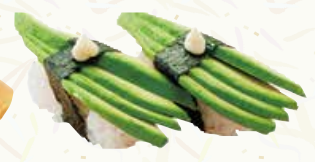
アボカド 130円(税込143円)