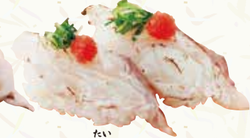
たい 鯛炙り 320円(税込352円)