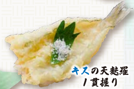
キスの天麩羅 1貫握り 150円(税込165円)