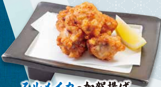
スルメイカの加賀揚げ 450円(税込495円)