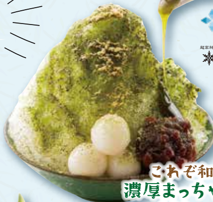
これぞ和の極み。 濃厚まっちゃ白玉金時 600円(税込660円)