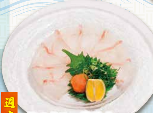
タマクエの薄造り