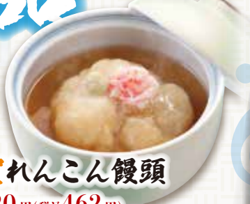
加賀れんこん餃子