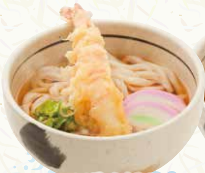
エビ天うどん 410円(税込451円)