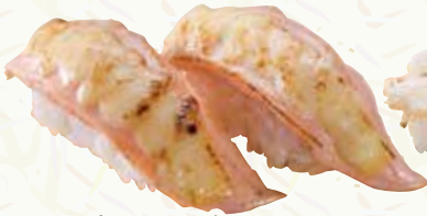
サーモンチーズ 310円(税込341円)