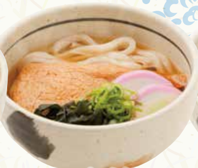
きつねうどん 360円(税込396円)