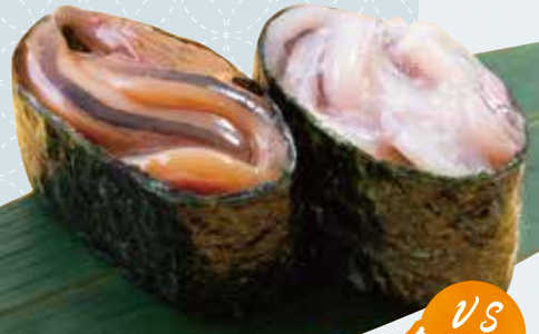
イカの塩辛と塩麹漬け 310円(税込341円)